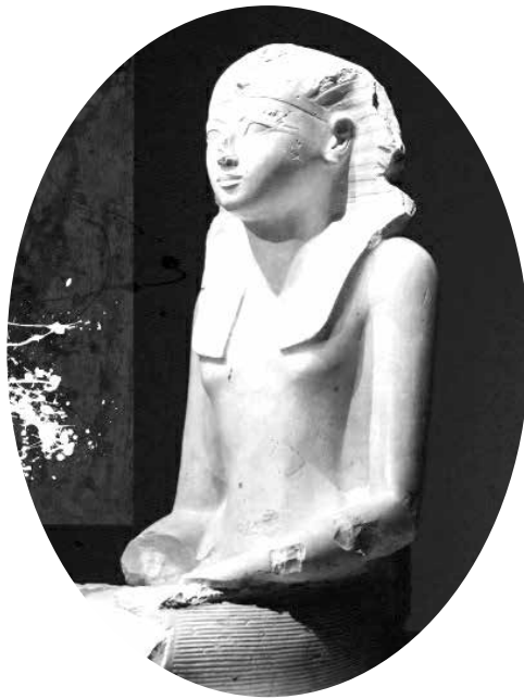
حتشپسوت (حدود ۱۴۵۸- حدود ۱۵۰۷ ق.م)

۱/ نگاه هلیکوپتری: هر چند نمی‌توان گفت که حتشپسوت نخستین رهبر سیاسی زن در تاریخ بوده است اما به درستی به‌عنوان یکی از موفق‌ترین آن‌ها به شمار می‌رود. با وجود موانع بی‌شمار، او فرعونِ ثروتمندترین و قدرتمندترین حکومت دنیای باستان در ۱۴۷۸ سال پیش از میلاد شد. با تصاحب قدرت، او با استفاده از مهارت‌های سیاسی خود، رهبری را برای بیش از ۲۰ سال حفظ کرد. با تولد در خانواده‌ای با اصل و نسب سلطنتی به‌عنوان بزرگ‌ترین دختر توتمس اول و ملکه احموس، حتشپسوت با برادر ناتنی کوچک‌تر خود، توتمس دوم ازدواج کرد