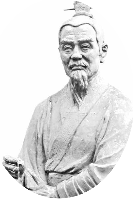
کنفوسیوس (حدود ۴۷۹- حدود ۵۵۱ ق.م)

۱ / نگاه هلیکوپتری: کنفوسیوس معلم و فیلسوفی بود که میراث او در مقام نگرهانی از تمدن چین، حفظ ارزش‌های سنتی چینی در نظام نامه‌ی اخلاقی نوین بوده است. کنفوسیوس، مولود خانواده‌ای متوسط با آموزش خوب، با مشاهده‌ی کارکردهای حکومت در یک دوره‌ی گذار از تاریخ چین، به مدیریت سیاسی نیز تبدیل شد. برای حدود ۳۰۰ سال کشور در صلح و کامیابی به سر برده بود - دوره‌ی بهار تا پاییز - که از سوی بسیاری به چیزی نسبت داده می‌شد که دانشمندان آن را «امتیازی از جانب خدا» می‌نامیدند. اما بدنبال رقابت فرماندهان